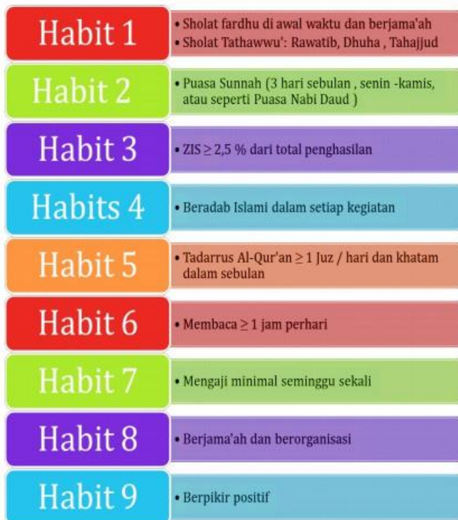
Gambar 3. The 9 Golden Habits.